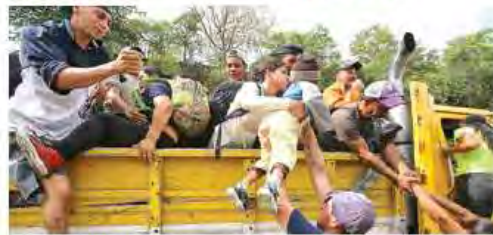
REFUERZA PFFRONTERA. En el transcurso de la mañana de hoy llegarán a México.

La Cancillería informó que quien quiera el reconocimiento de refugiado deberá pedirlo de forma individual. Estas medidas se opusieron con la postura inicial del gobierno de Chiapas, que habría autorizado el libre tránsito de la caravana en la entidad. En Tamaulipas, AMLO dijo que ya prepara un plan "... pues no sólo atiende remos el asunto con deportaciones". — M. Juárez / M. León / PÁGS. 40 Y 41