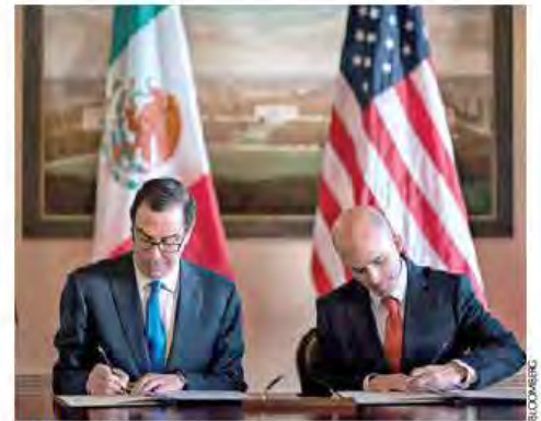
WASHINGTON. Mnuchini y González Anaya firman compromisos.