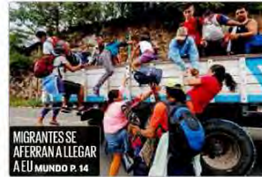
MIGRANTES SE AFERRAN A LLEGAR A EU MUNDO P. 14

Hacen historia... y largas filas por marihuana lúdica. Canadá se convirtió ayer en el primer país industrializado en legalizar el uso de la cannabis con fines recreativos, por lo que decenas de consumidores hicieron filas para ser los primeros en comprar la droga, de la cual pueden portar hasta 30 gramos y deberán abstenerse de fumarla en bares y restaurantes MUNDO P. 13