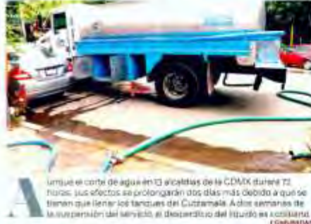
Un truco: el corte de agua en 13 alcantarías de la CDMX durante 72 horas, sus efectos se prolongarán dos días más debido a que se tienen que llenar los tanques del Cuernavaca. A dos semanas de la suspensión del servicio, el desperdicio del líquido se contabiliza.