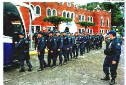
Ya vigilan el puesto fronterizo de Talismán, en Tuxtla Chico.