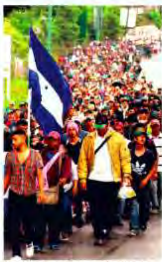
Miles de inmigrantes haitianos y cubanos en una marcha por sus derechos en la zona turística de San Juan de los Ríos.