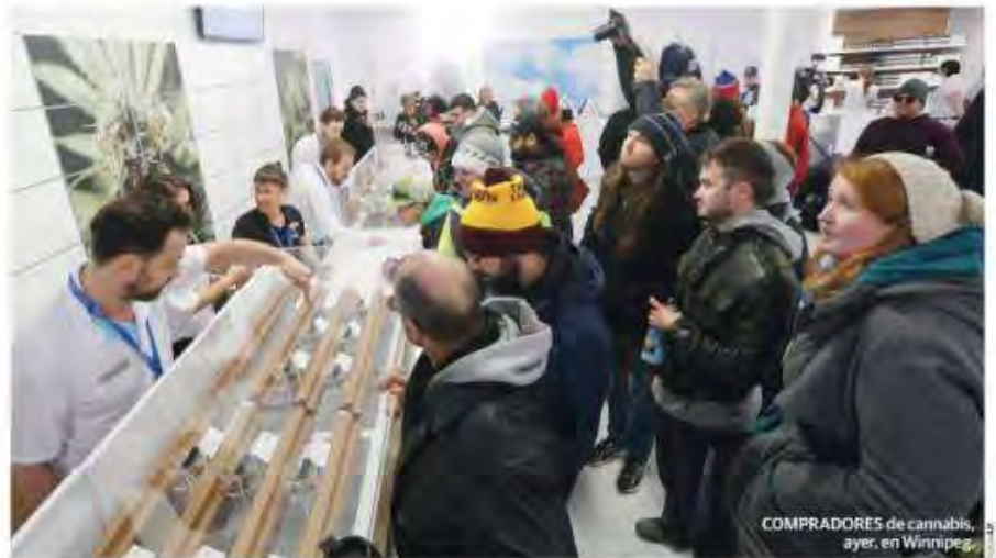
COMPRADORES de cannabis, ayer, en Winnipeg