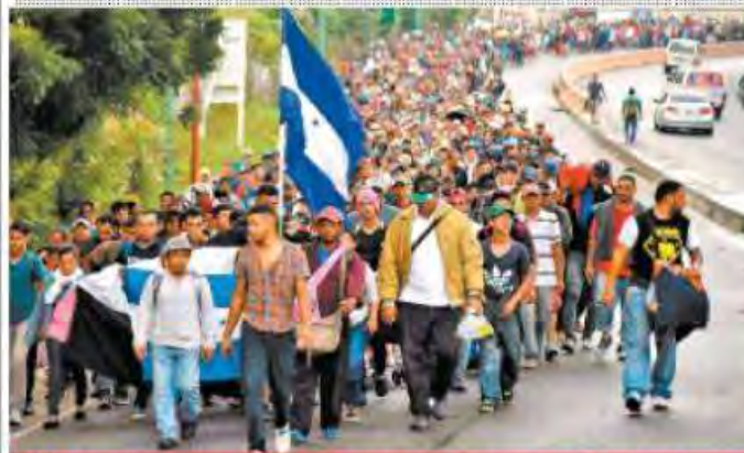
AM VIENEN. Mientras la caravana de hondureños marcha por Guatemala y se encuentra a un paso de llegar a Chiapas, López Obrador ofreció trabajo a los centroamericanos a partir del 1 de diciembre. P. 30

VAN CONTRA ARANCELES Acuerdan Peña y el electo renombrar el nuevo TLC como T-MEC P. 7 Y 25