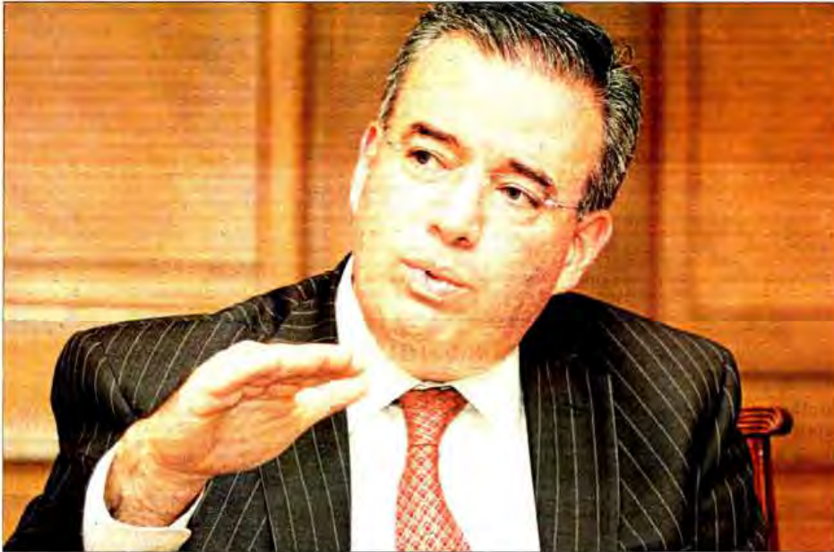
▲ Alejandro Díaz de León, gobernador del Banco de México, defendió que la institución mantenga como mandato preservar el poder adquisitivo del peso. En una economía como la mexicana, agregarle